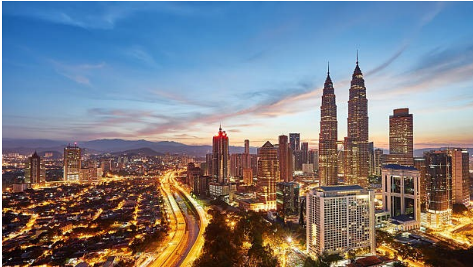
(株)DAN 都市デザイン 研修旅行 2024 マレーシア クアラルンプール