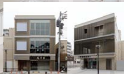
金沢八景風月堂ビル / 金沢八景駅前ビル