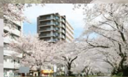
ライフレビュー相模原